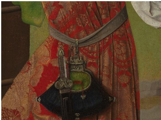
Image 8 Triptyque de la Descente de Croix, détail du panneau central après restauration, Dieric Bouts, v. 1455-1460.