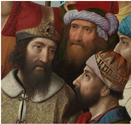
Image 7 Triptyque de la Descente de Croix, détail du volet gauche après restauration, Dieric Bouts, v. 1455-1460.