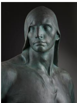
Foto 5: Constantin Meunier, De buildrager (detail), gepatineerd gips, 220 x 124,7 x 93,5 cm, Meuniermuseum (KMSKB), Elsene.

In 2031 zal de 200 ste verjaardag van de geboorte van Meunier worden gevierd. Met het oog op dat feestjaar, zou in de tien jaar die ons daarvan scheiden de gipsotheek aan een grondig materiaal-technisch onderzoek moeten worden onderworpen. Door Meuniers gipsen van naderbij te bestuderen, hopen we alteratieprocessen beter te vatten en gepast te kunnen ingrijpen om de steeds verder aftakelende kunstwerken te vrijwaren. Het doel is om de stukken door middel van conservatorische ingrepen en restauraties terug tentoonstellingwaardig te maken zodat ze vervolgens kunnen worden inschreven in een nieuwe collectiepresentatie in het Meuniermuseum.