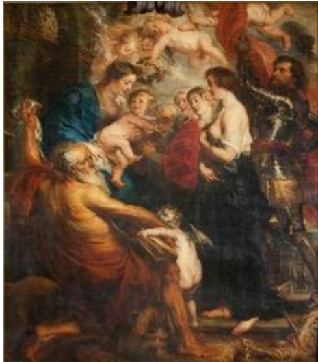
Foto 3: Pieter Paul Rubens, O.-L.-Vrouw met Kind omringd door heiligen , ca. 1630, Olieverf op paneel, 220 x 193 cm, Sint-Jacobskerk, Antwerpen.

Vandaag heeft de laatste rustplaats van deze schilder echter dringend nood aan een conservatie-restauratie ingreep. Zowel het schilderij in het altaarstuk als de architecturale omlijsting en het Mariabeeld van Faydherbe vragen onze aandacht. Dit zou zonder meer een heel bijzonder project kunnen worden. De restauratie van de oostzijde van de Sint-Jacobskerk (het schip en de zijbeuken) is net afgerond. In 2022 start de restauratie van alle daken, gevels en vensters van het transept, koor en de kapellen rond het koor, waaronder de grafkapel van Rubens. Een unieke kans om ook het interieur van de grafkapel aan te pakken, om zo de grafkapel als eerste, volledig gerenoveerde ruimte in de Sint-Jacobskerk in 2024 opnieuw open te stellen en Rubens blijvend te eren.