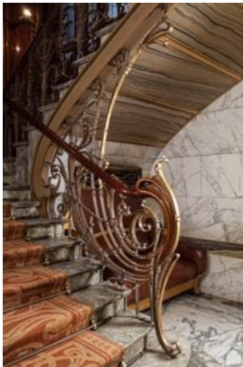
Foto 4: Aanzet van de eretrap, hout en verguld ijzersmeedwerk, Hotel Solvay, Brussel, Victor Horta (architect), 1894-1903.

Vandaag telt Brussel nog zo’n 500 Art Nouveau gebouwen. Hiervan zijn ongeveer 250 gedeeltelijk of volledig beschermd. De Brusselse regering neemt talrijke initiatieven om ervoor te zorgen dat ook de volgende generaties van dit prachtige erfgoed kunnen genieten. Zo werd afgelopen zomer beslist om 2023 tot het jaar van de Art Nouveau te wijden. In de aanloop naar 2023, maar ook nadien, moeten talrijke restauraties uitgevoerd worden. Samen met de bevoegde administratie en het publiek gaan we op zoek naar waardevolle en urgente projecten waarin we samen het verschil kunnen maken.