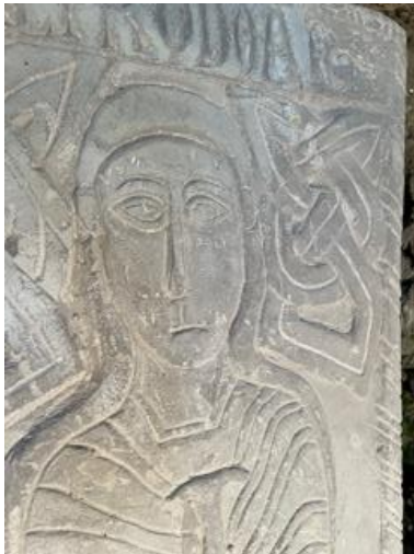
Foto 2: Sarcofaag van Chrodoara (detail), ca. 730, Savonnières steen, 184 x 57 x 71 cm, Collegiale kerk van Sint-Joris-en-Sint-Oda, Amay.

Voor velen is de Merovingische sarcofaag van Amay een onbekende erfgoedschat. Daar willen we verandering in brengen! De sarcofaag staat tentoongesteld op de plaats waar ze in 1977 gevonden werd: vlak voor het hoogaltaar van de kerk, op ongeveer drie meter diepte. Ze is zichtbaar door een glazen vloerplaat. In samenwerking met de stad, de kerkfabriek en het lokale museum werken we een plan uit voor een verbeterde ontsluiting van deze unieke sarcofaag. In functie daarvan gaan we ook na welke ingrepen nodig zijn op de sarcofaag zelf en zorgen we voor een optimale bewaringstoestand. Zo garanderen we de toekomst van deze erfgoedschat en schenken we nieuw leven aan de heilige Chrodoara.