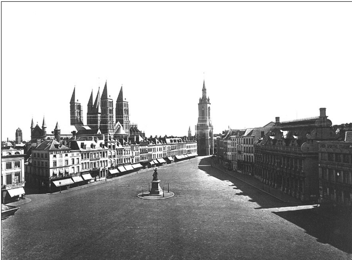
F488 - Doornik, De Grote Markt, Zuid kant en Noord kant.