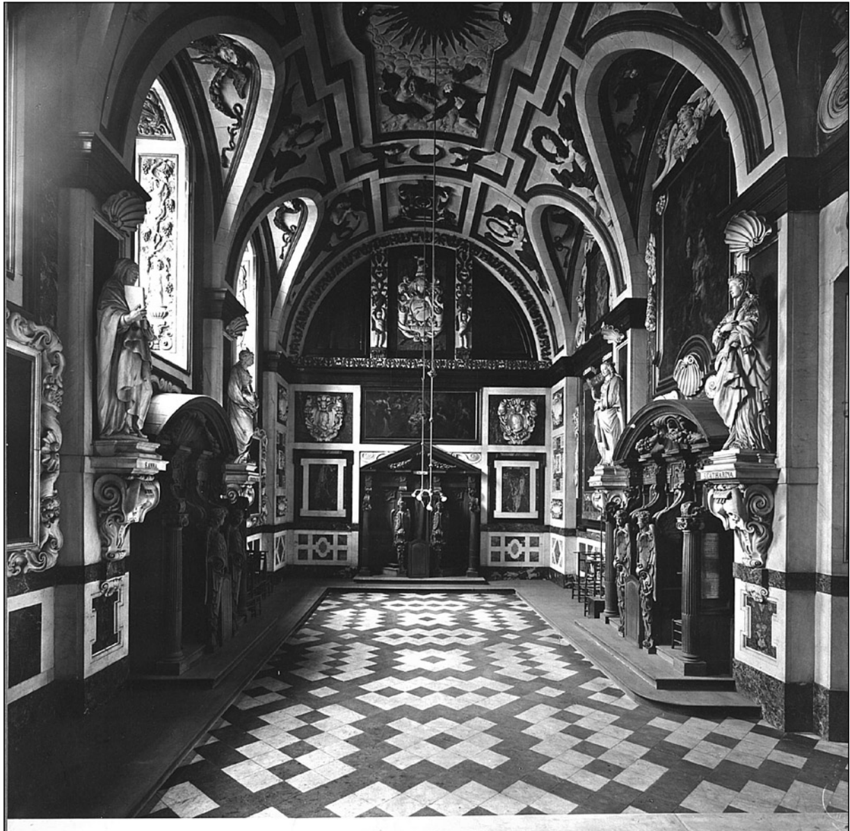
F60 - Antwerpen - Sint-Carolus Borromeuskerk. Interieur. De kapel van O.-L.-Vrouw, gezicht vanaf het altaar.