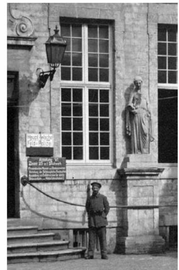
F150 - Brugge, de Proosdij (nu zetel van het Provinciebestuur). Binnenkoer.