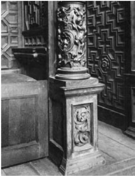
B20034 - Biechtstoel (detail).