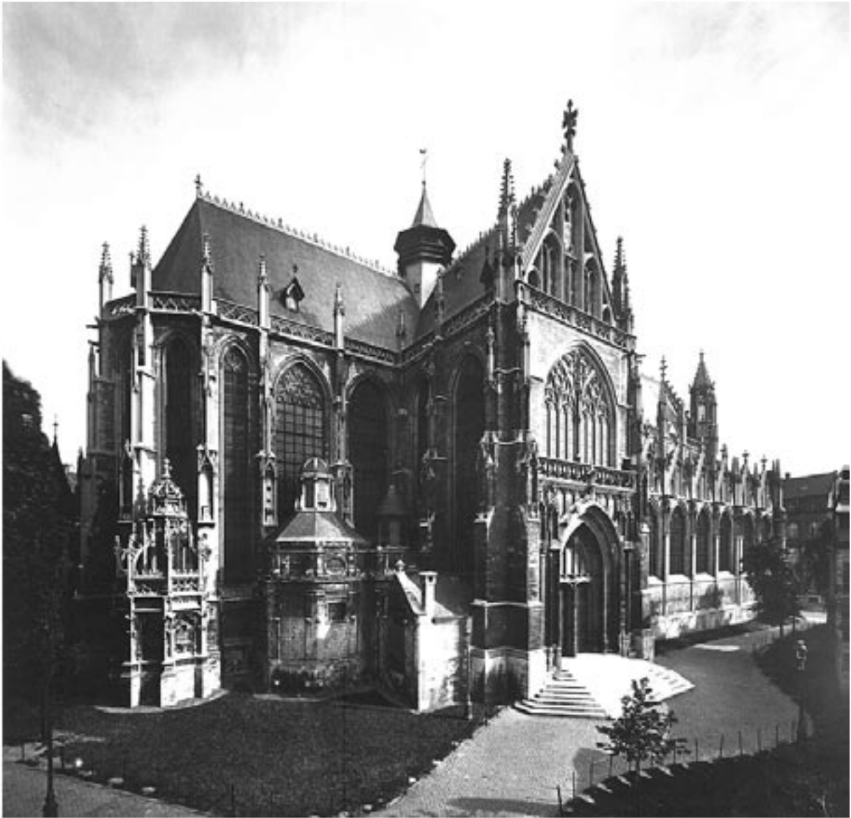
F274 - Brussel - Kerk van O.-L.-Vrouw van de Zavel. Hoogkoor en noordelijk transept. Achter het hoogkoor het "Sacarium", gotisch gebouwtje uit de 16 de eeuw. In de hoek van koor en transept, de kapel van Tour en Taxis, uit de 17 de eeuw.