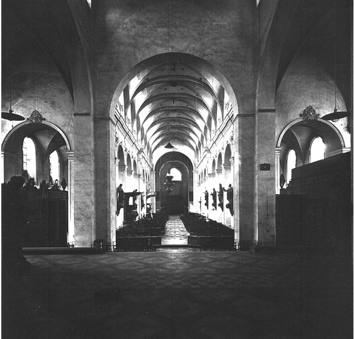
F481 - Nijvel - Sint-Gertrudiskerk. Algemeen gezicht vanuit het Zuidwesten.