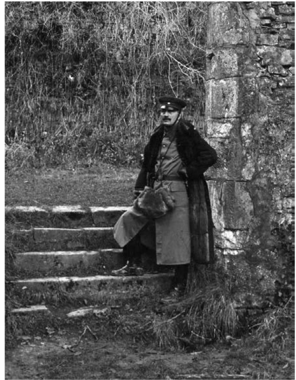
B20847 - Oude Abdij van Orval.

Details van enkele zeldzame foto's met Duitse militairen.