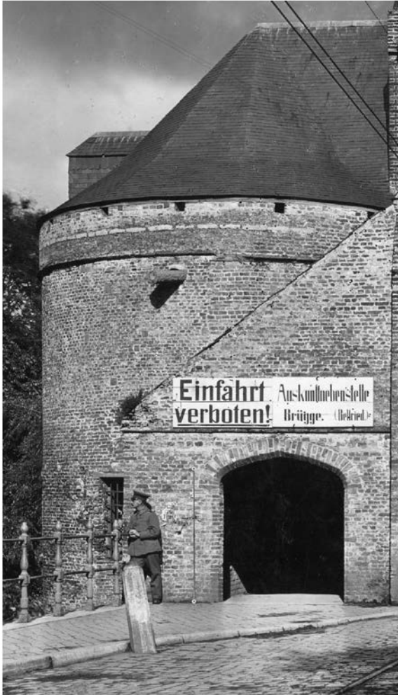
F128 - Brugge - Stadspoort.