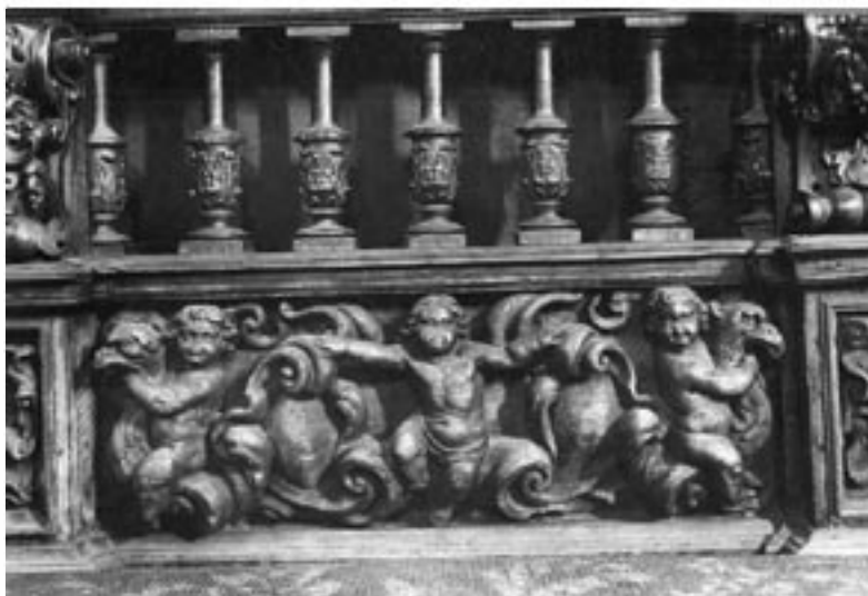
B20048 - Communiebank (detail).

Namen, Sint-Lupuskerk, biechtstoelen en communiebank, ca 1650-1670.