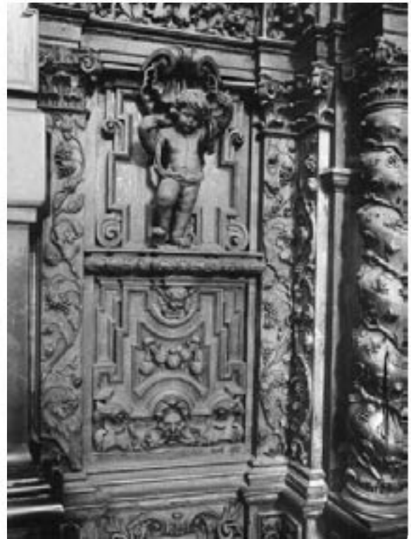
B20036 - Biechtstoel (detail).