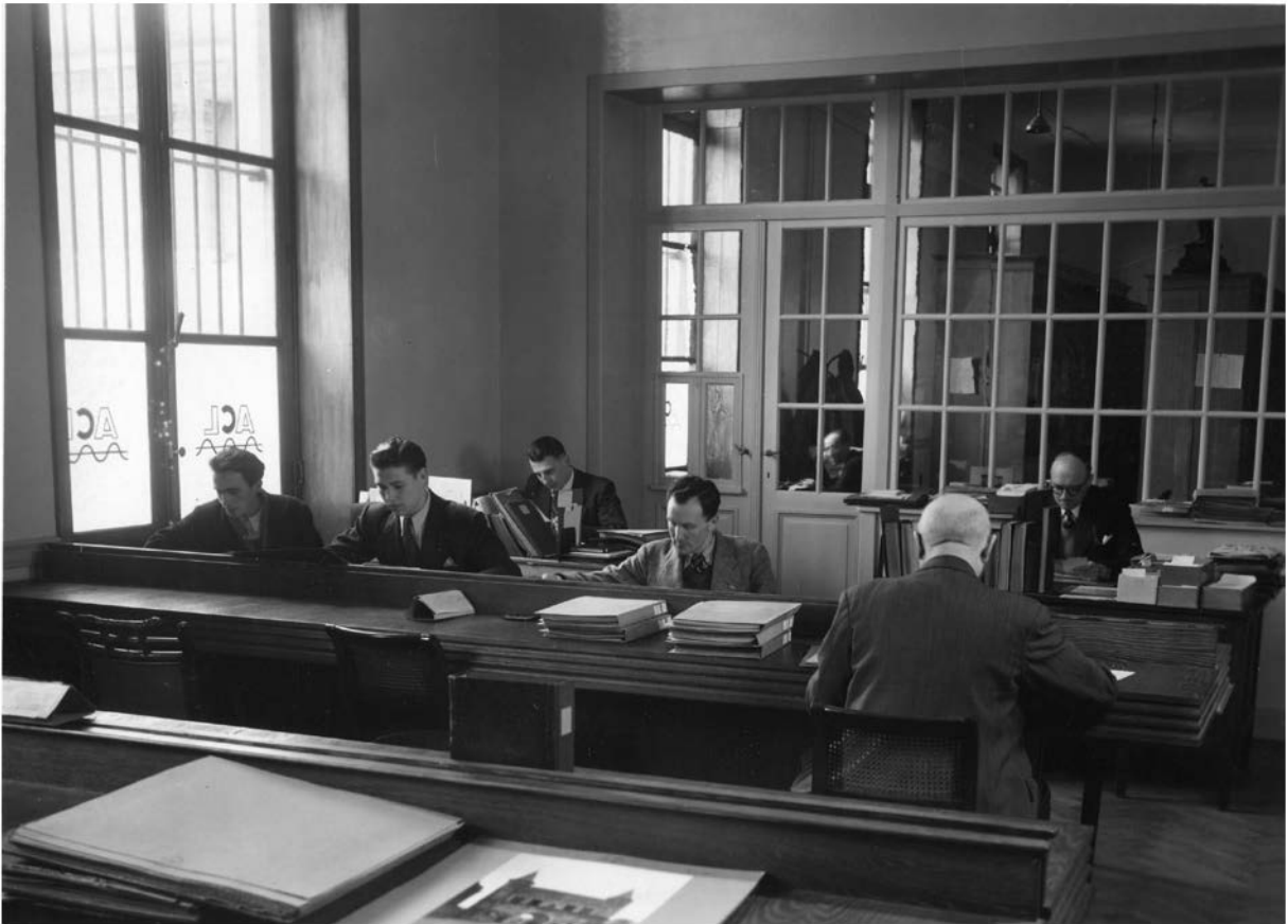
De leeszaal van de fototheek in 1948.