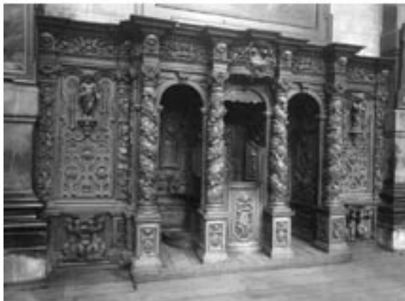
B20019 - Biechtstoel (ensemble).

Namen, Sint-Lupuskerk, biechtstoelen en communiebank, ca 1650-1670.