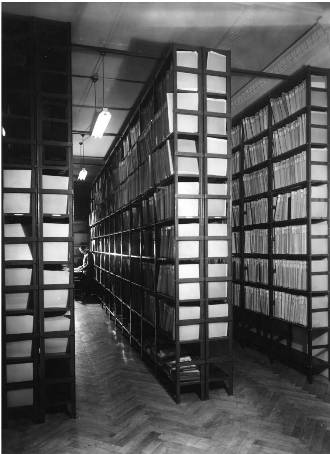
Interieur van het fotodepot van het ACL in de lokalen van de KMKG. 1948.