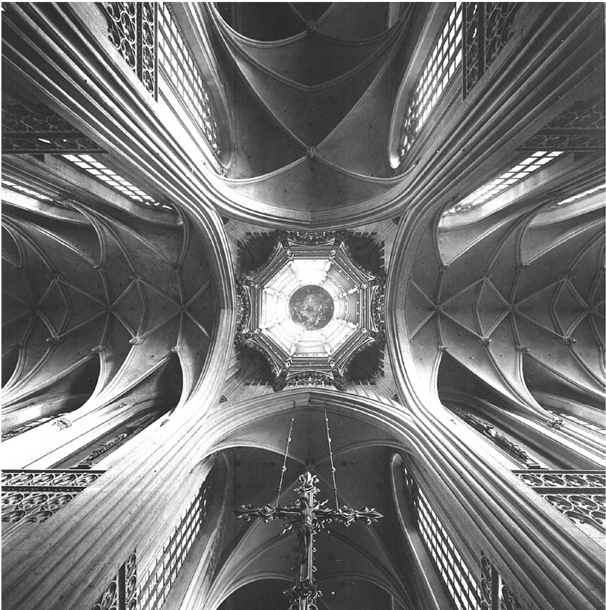
F36 - Antwerpen - O.-L.-Vrouwekathedraal. Interieur. De vieringkoepel.