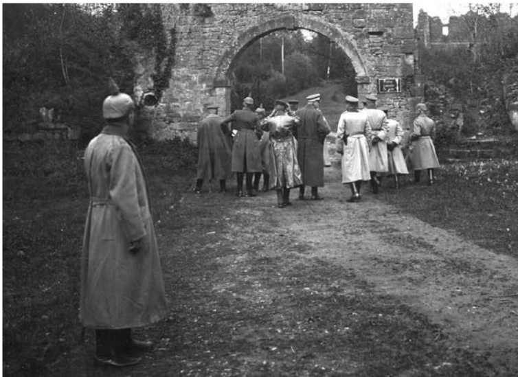
B20846 - Ruïnes van de oude Abdij van Orval.

Details van enkele zeldzame foto's met Duitse militairen.